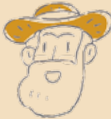
El/La presidente de una cooperativa de agricultores