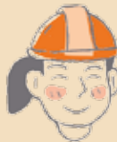
Jefe técnico de Servicios de Residuos